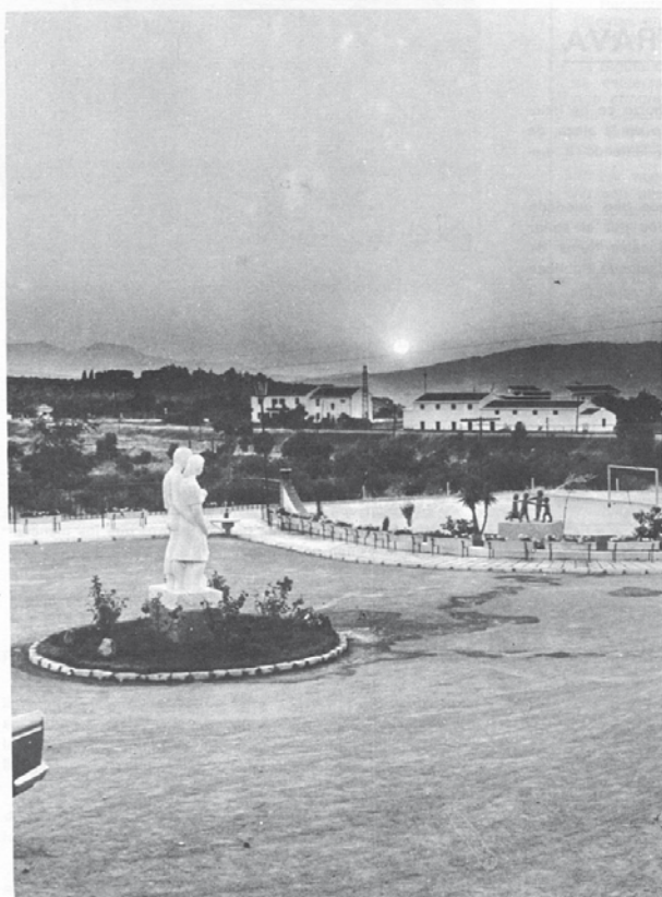
Un exterior de las Delicias

N O hace muchos días ha dado a luz la Caja de Ahorros de Ronda, su libro de oro, en donde se recogen con cariño y esmero, toda la gran Obra Benéfico Social de esta Entidad, que extiende sus beneficios en todas sus direcciones.