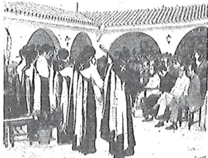
La Tuna del Colegio interpretando una serie de canciones